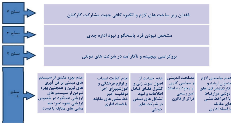
شکل (۱) مدل‌سازی موانع اجراء خط‌مشی‌های مقابله با فساد اداری

پس از تعیین روابط و سطوح، موانع در چهار سطح قرار گرفتند که در بالاترین سطح یعنی سطح چهار، مقوله فقدان زیر ساخت‌های لازم و انگیزه کافی جهت مشارکت کارکنان (۳) قرار گرفت. در پایین‌ترین سطح یعنی سطح یک، عدم توانمندی لازم مدیران ارشد و کارکنان شرکت‌های دولتی در ارتباط با اجراء خط‌مشی‌های مقابله با فساد اداری (۱)، مصلحت‌اندیشی و سیاسی‌کاری و وجود ارتباطات غیر رسمی فراتر از قانون (۵)، عدم بهره‌مندی از سیستم‌های مبتنی بر فن‌آوری‌های نوین و همچنین بهره‌نبردن از سیستم‌های ارزیابی عملکرد در خصوص ارزیابی نحوه اجراء خط‌مشی‌های مقابله با فساد اداری (۶)، عدم کفایت اسباب و لوازم فرهنگی و آموزشی برای اجراء موفقیت‌آمیز خط‌مشی‌های مقابله با فساد اداری (۷) و عدم حمایت از اصل سوت‌زنی و کنترل فضای تبادل اطلاعات و نبود تشکل‌های صنفی در شرکت‌های دولتی (۸) قرار گرفتند.